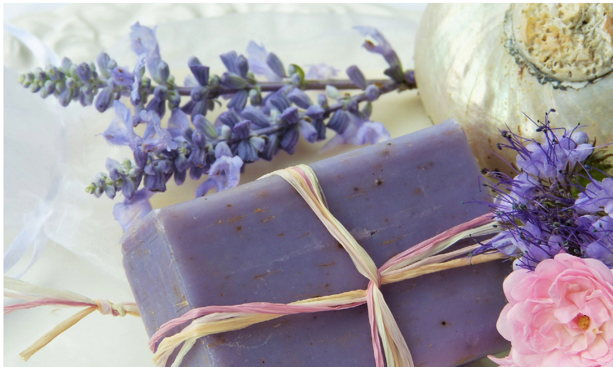
Sin egen tvål kan man lära sig att göra i en kurs som hålls lördagen den 18 februari.

719808 LYCKAS MED DINA KRUKVÄXTER / ONNISTU KASVEILLASI On 15.2.2023 kl. 18.30–20