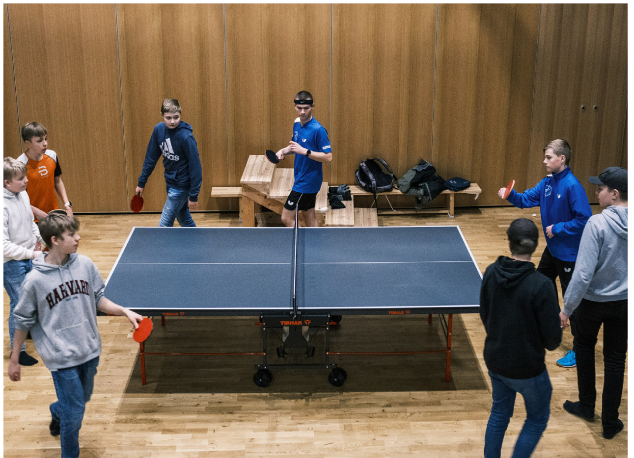
Klubbverksamheten inleds med uppvärmning.