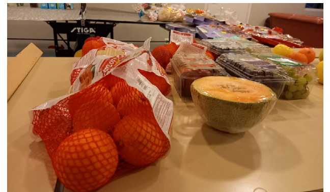
I fjol delades 2000–3000 matkassar i Vörå.

Mathjälpen delar ut kassar i Oravais i församlingscentret på Kimovägen 19 på