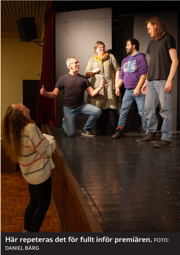
Här repeteras det för fullt inför premiären.

– Men vi har faktiskt fått många nya unga skådespe-