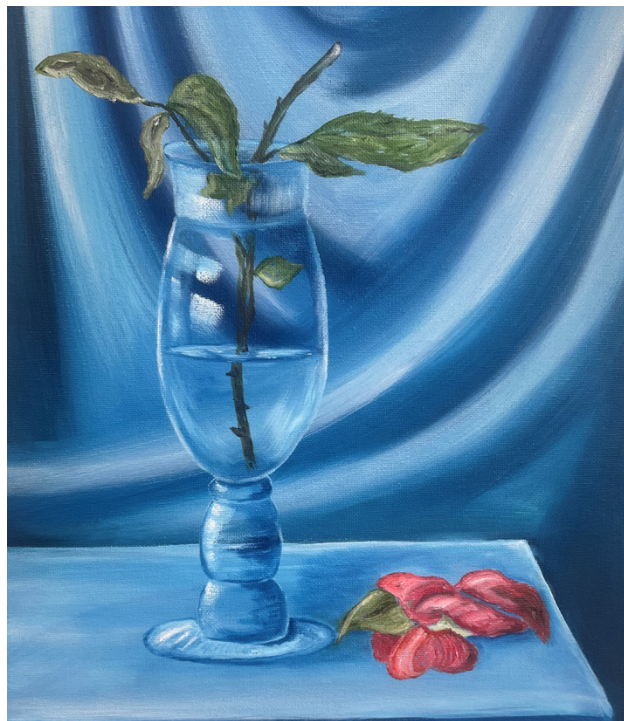
Kuusinen maalaa de motiv han för tillfället känner för och använder sig av olje- och akrylfärg men även kol.

Kuka tahansa voi pitää kirjastossa näyttelyitä ilmaiseksi. Näyttelypanijat asettavat itse taideteoksensa esille. Kirjasto