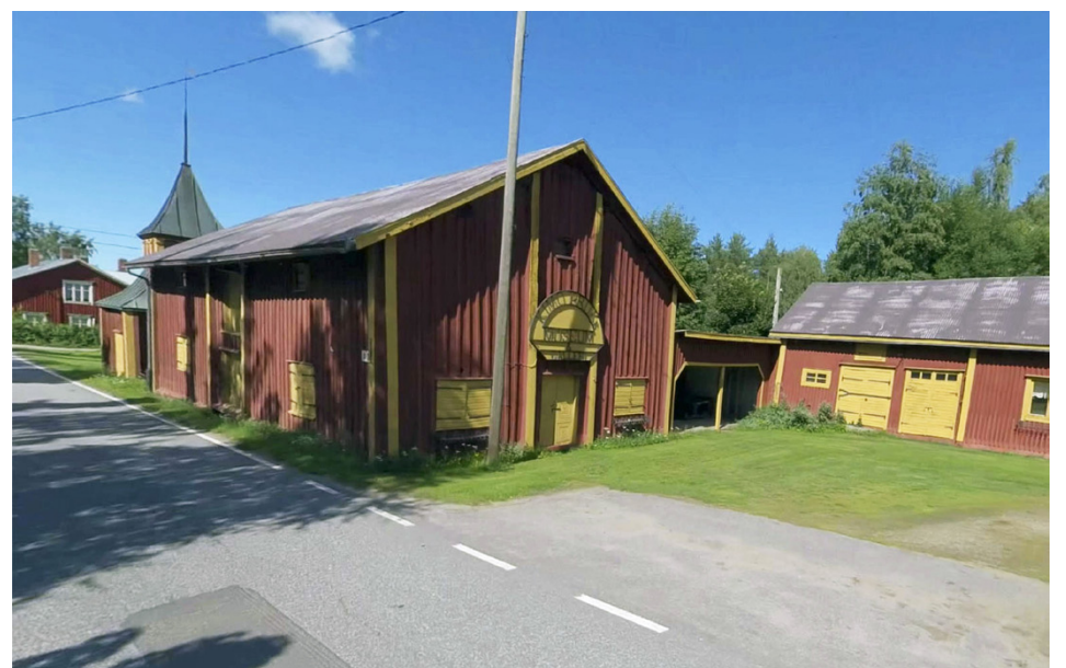
Bland annat Kimo bruk ligger längs leden.

Information om ledens dragning, frågor om bl.a. logi, information och annan service. Anmälan senast 24.4 via https://forms.office.com/r/WQ8Jki6hr