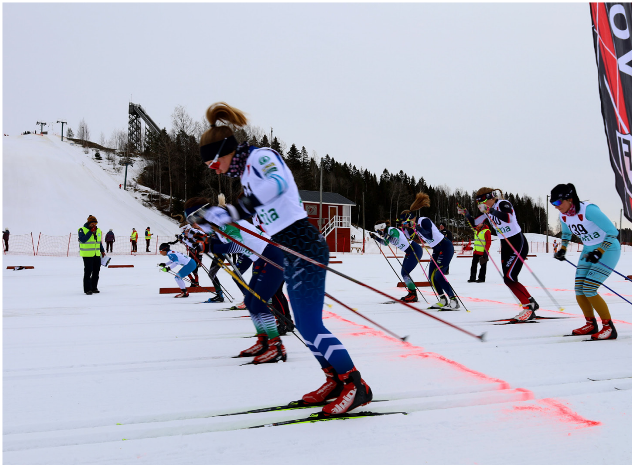
Klara... Färdiga... ÅK! Här går en start under Final climb vid Vörå skidcentrum.