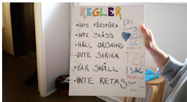
De här reglerna gäller för alla som besöker Källarn. Man ska inte förstöra, slåss eller retas. Då har alla det bra.

På ett fönsterbräde står en hel del tomflaskor. Orsaken är enkel: ungdomarna vill ha en tv, och en Playstation. Det är därför pantflaskorna nu samlas in till utrymmet.