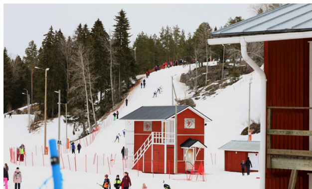
Det är en tuff klättring som gäller för skidåkarna.