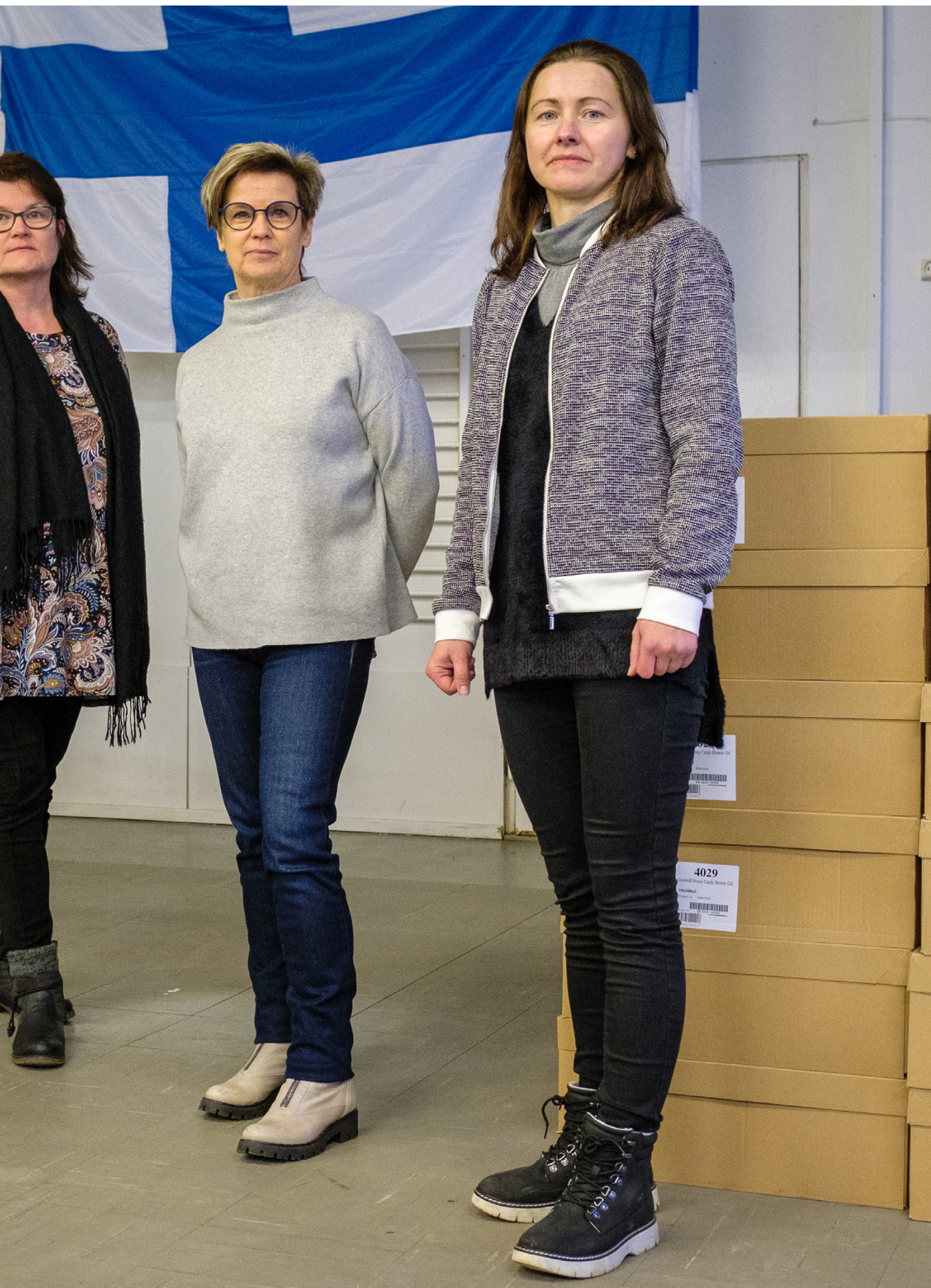
är glada över den stora hjälpviljan som finns i kommunen.