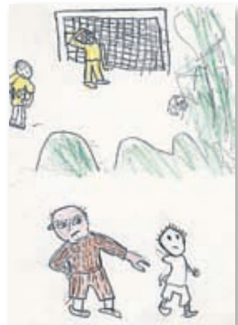
Yah Htoo Rah

Det var bra att sagan även fanns som film så att man fick se filmen efter att sagan var läst.