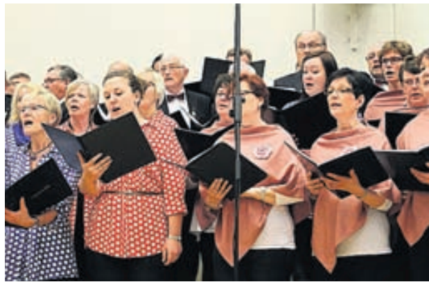
Stora blandade kören bjöd på mäktiga toner. Aquarelle och Kör för alla i förgrunden. Också Oravais Manskör, Rågbröderna och Pensionärskören medverkade.