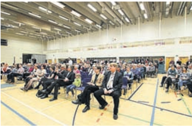
Många ville höra köerna och orkestrarna på medborgarinstitutets stora sång- och musikkavalkad. Norrvallas stora festsal var nästan fullsatt.