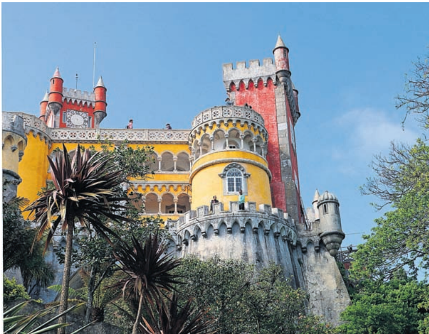
Att se det här sagoslottet var en av höjdpunkterna på resan! Palácio da Pena ligger högst uppe på bergskränet ovanför staden Sintra.