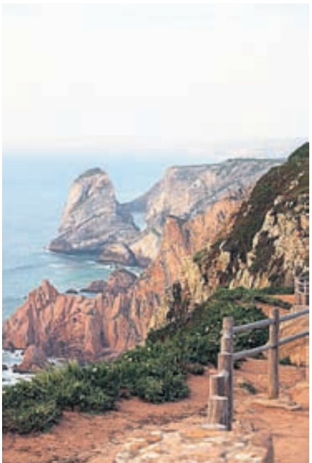
Cabo da Roca med sina mäktiga klippor är det europeiska fastlandets västligaste punkt.