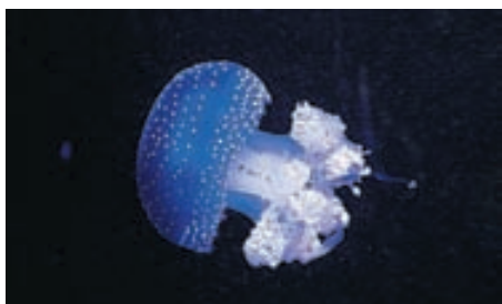
I Lissabon finns ett av världens största akvarier. Basgrupp fyra fick gå på backstagetur och se vad som finns bakom kulisserna. På bilden syns en vitprickig manet från Australien.