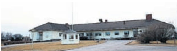
Pakolaistoimiston tilat Öjvägenin varrella Oravaisissa.

Tabernassa, 7 Stellassa ja 12 Stödiksessä. • Vöyrin kunta tarjoaa lisäksi 15 jälkihuoltopaikkaa 18–21-vuotiaille pakolais- nuorille.