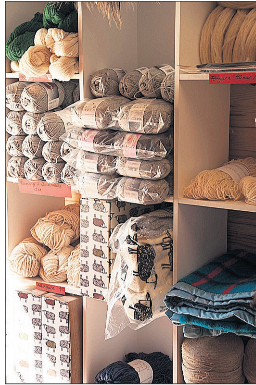
Malaktgårdenista saa ostaa lampaanlihaa, lankoja, villaa, nahkaa ja Highland-lihaa.

tossa, joka vuodesta 2006 on ollut mukana Unescon maailmanperintöluettelossa. Torpalla tarkoitetaan perinteisesti pientä taloa, jossa asusteli isommasta tilasta osan vuokrannut viljelijä perheineen. Vuokran torpparit maksoivat tekemällä isäntätalolle määrätyn määrän töitä eli taksvärkkiä. Nykyään Maxmo Torpassa toimii Bed and Breakfast – majoitusyritys.