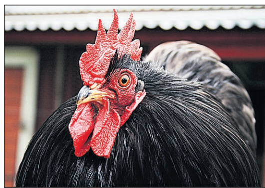
Tuppen Fantomen är en ståtlig dvärgkochin.

– Det ryms inte fler sorter. Där emot vill jag ha fler av varje sort, så att jag kan ta emot större beställningar. SIDAN 3