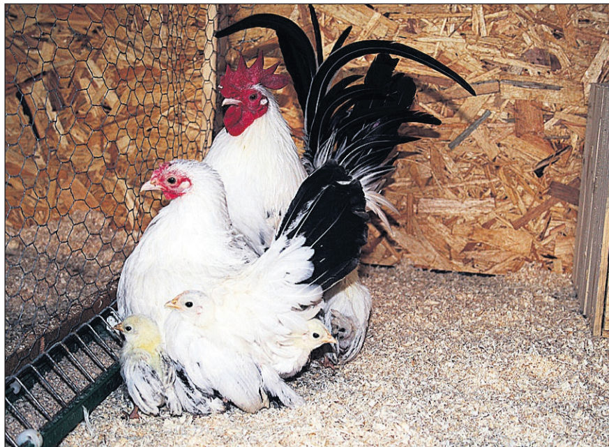
Familjen chabo. Tuppen och hönan vaktar sina veckogamla kycklingar noga. Bara tre av de sex ungarna syns, resten gömmer hönan i sin fjäderskrud.