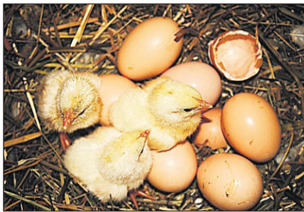
En dag gamla sussex-kycklingar.