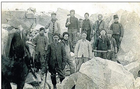
Stenbrottet i Colorado.