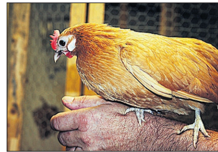
Den holländska dvärghönan är social.