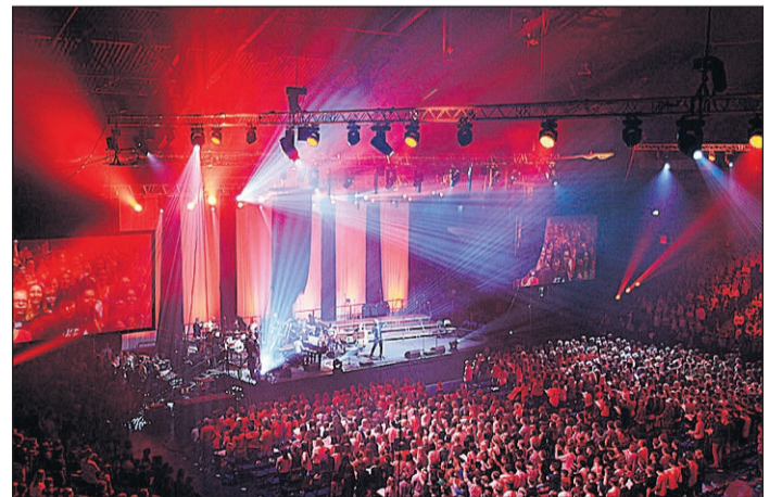
Skolmusik 2013 kulminerade i festkonserten med 6000 sångare på scenen. Om tre år hålls Skolmusik i Korsholm.