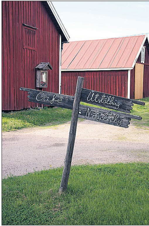
Klemetsintaloilla on tekstiilien ja vanhojen moottoripyörien näyttely.

Myös Maxmo Torp sijaitsee kauniissa Maksamaan saaris-