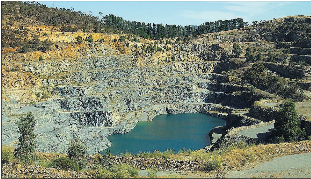
Så här ser det ut i stenbrottet i dag.

Lokaltidningen skrev om den tragiska händelsen den 26 sep-