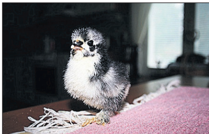
Tre dagar gammal dvärgekochin som kläckts i maskin. Pappa heter Fantomen.