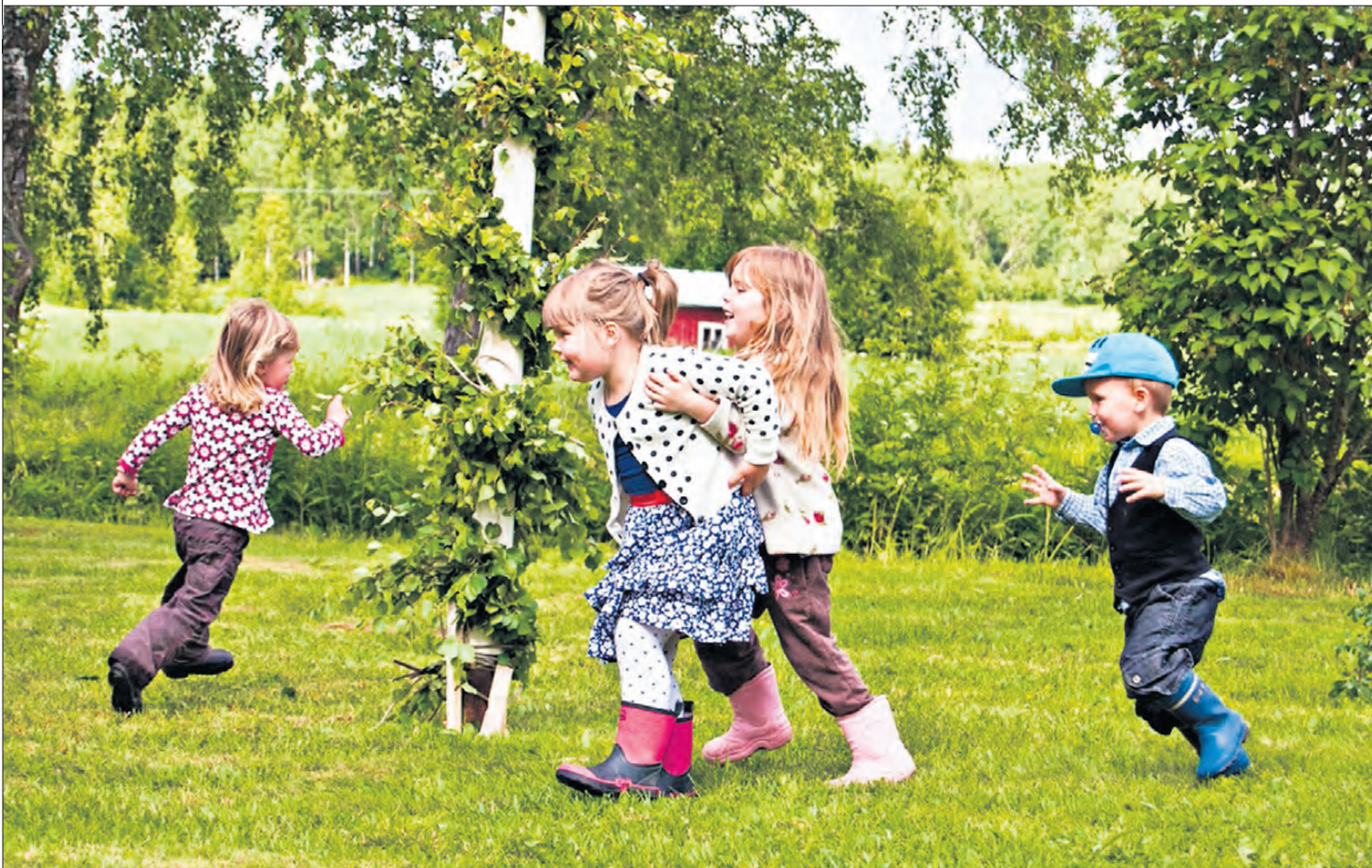
Bilden är tagen i Karvat den 24 juni med några av byns barn som dansar runt midsommarstången. Fotografen Stefan Lassus bor i Glenties, Irland.