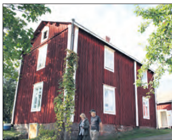
Vid Klemetsgårdarna ordnades marknad och soppa serverades till dem som var hungriga Men förmiddagens regn störde.