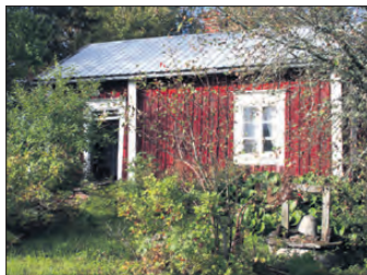
Söndagsskolmuseet i Maxmo var en ny bekantskap för många.