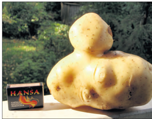
Denna potatisskulptur hittades i Emmas och Ulfs potatisland i Kimo. Den vägde 650 gram. Fotograferad och uppäten av Evi Engström.