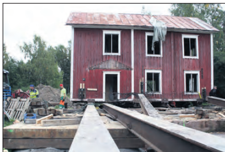
Huset har dragits över kraftiga järnbalkar och vilar nu på lavetten.