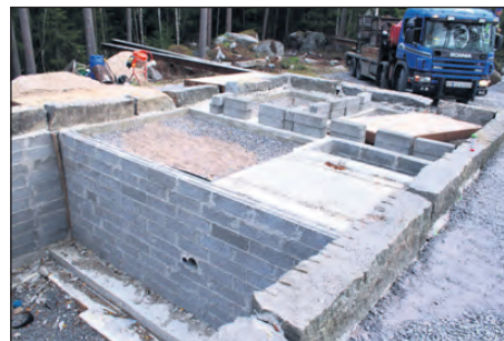
Grunden är klar och väntar på husleverans. I källaren ska förrådsutrymmen finnas.