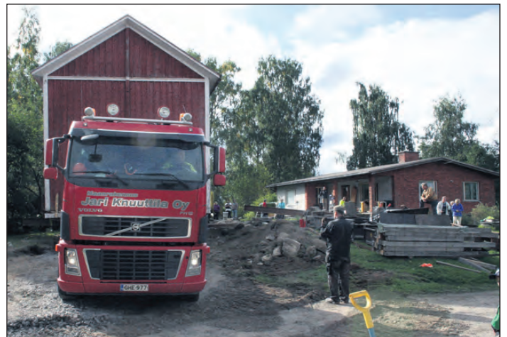
Huset är lastat och allt gick som planerat. Inget gick sönder. Men nu ser gårdsplanen plötsligt helt annorlunda ut.