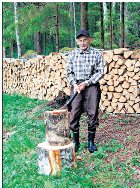
Bilden är tagen i mitten av juni 2011 i Lotlaxskogen vid Sven Backulls 30 meter långa "vedapino".