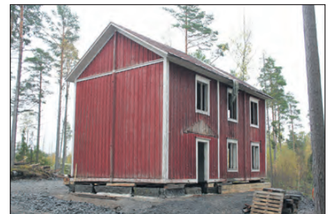
Det timrade huset ser ut precis som förut, även om det flyttats 300 meter söderut.