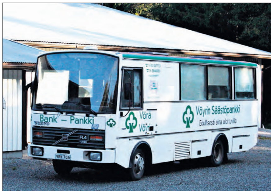
För 30 år sedan var den här bussmodellen toppmodern. Nu är bankbilen gammal och eftersom kunderna är få, lönar det sig inte att skaffa någon ny bankbil.